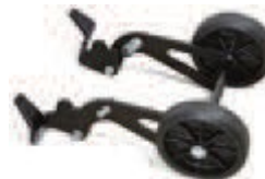
Kółka i wózki transportowe